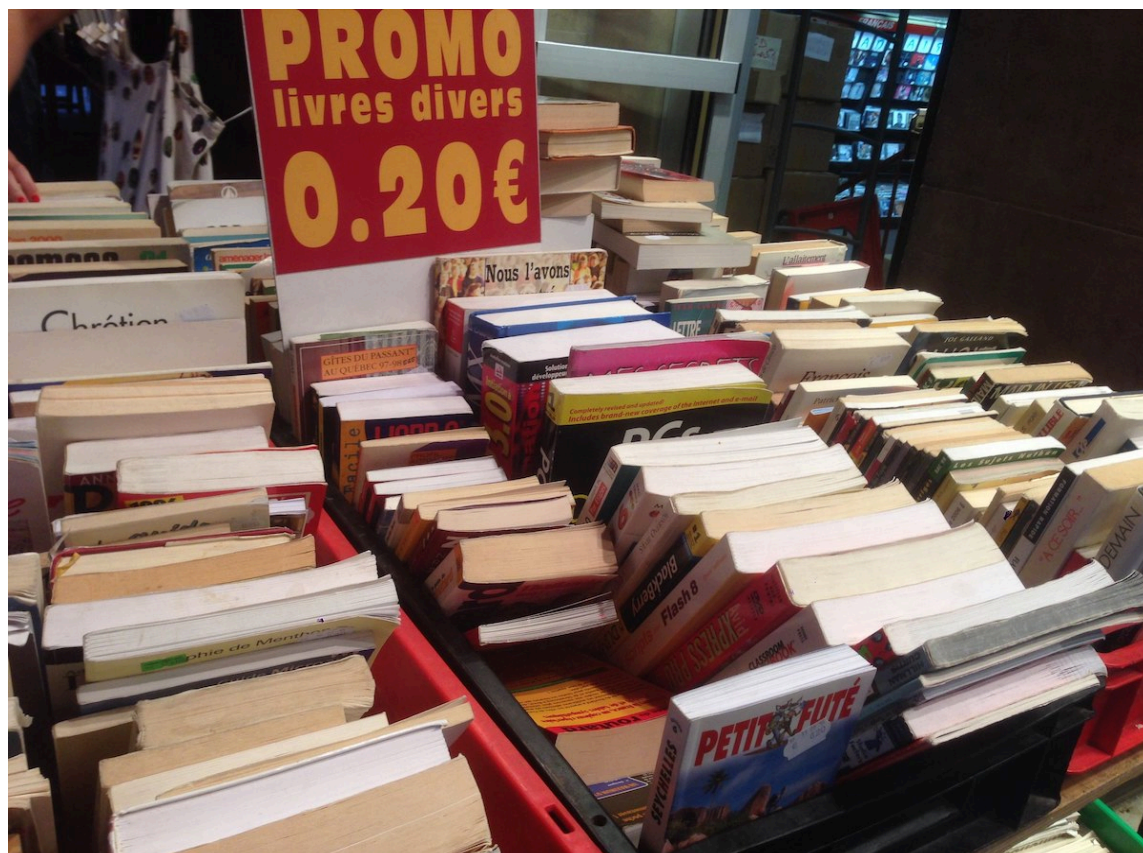
Présentoir de livres d'occasion chez Boulinier, Paris

Dans le domaine de l'occasion, « notre offre alimente notre demande : nous sommes en recherche de titres », précise-t-il. Toutefois, un stock de 2000 à 3000 ouvrages invendus du même ouvrage ne représente qu'un faible intérêt : les ventes d'occasion sont constituées d'une multitude de références qui s'écoulent à un ou deux exemplaires, sauf exception — les best-sellers d'un temps et certains classiques.